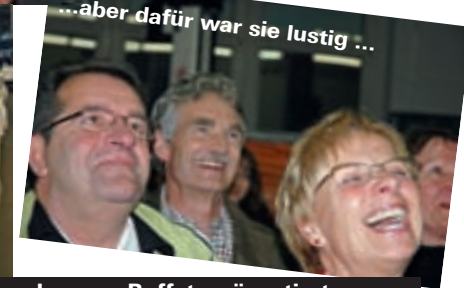
...aber dafür war sie lustig ...