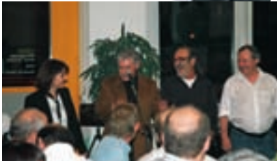
Schallendes Gelächter bei der Top-Bauchredner-Show von Roli Berner ...