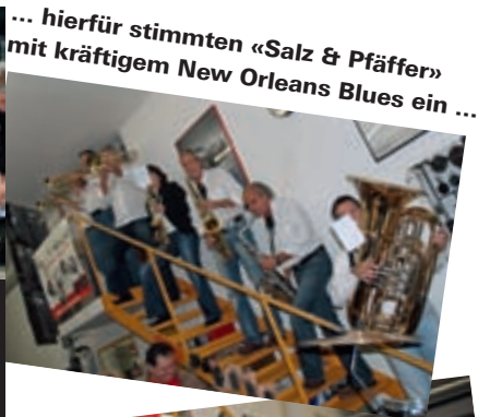
... hierfür stimmten «Salz & Pfäffer» mit kräftigem New Orleans Blues ein ...