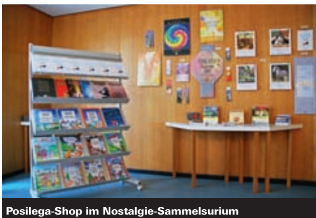
Posilega-Shop im Nostalgie-Sammelsurium

(mfu) Nach 10 Jahren Pause bietet der Posilegashop wieder eine Lokalität, in der die erheiternde Kalender- und Geschenkartikelauswahl ausgestellt ist und vor Ort gekauft werden kann. Die neue Shop-in-Shop Lösung finden Sie in der Galerie vom Nostalgie-Sammelsurium, das seit Ende August in Spreitenbach im Industrie-Härdli seine Tore geöffnet hat. Am 1. November findet dort ein Ausstellungs-Apéro statt, bei dem auch Sie herzlich willkommen sind.