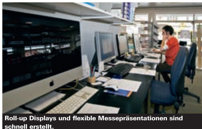
Roll-up Displays und flexible Messepräsentationen sind schnell erstellt.