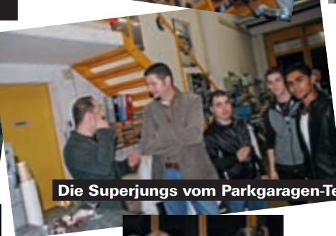
Die Superjungs vom Parkgaragen-Team ...