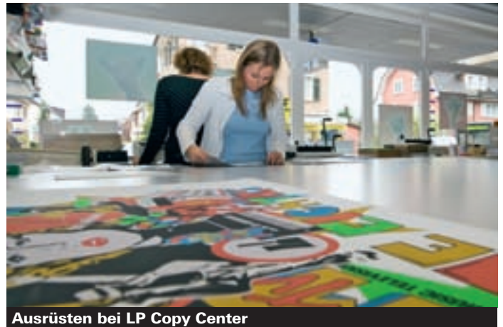
Ausrüsten bei LP Copy Center

365 Tage im Jahr kann bei LP Copy Center per E-Mail oder im Internet bestellt werden. Umfangreiche Datenfiles können auf den haus-eigenen Datenserver geladen werden, LP Copy Center verarbeitet zudem Daten ab PC und ab MAC. Firmenkunden aus der Grossregion Baden-Wettingen schätzen zudem den Lieferservice, der während den üblichen Öffnungszeiten kostenlos ist.