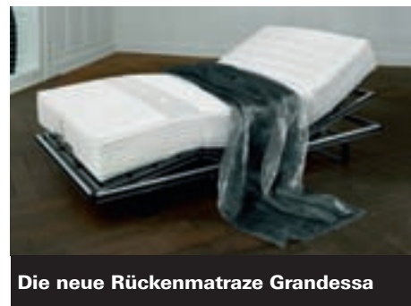
Die neue Rückenmatratze Grandessa

Jetzt 7. Matratzen-Festival bei Möbel Märki Dietikon, Riedstr. 1 (Pestalozzi-Haus).