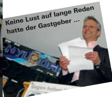
Keine Lust auf lange Reden hatte der Gastgeber ...