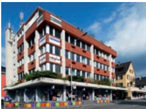
Geschäftshaus Landstrasse 15 in Wettingen

Ich bin Architekt, von einer Werbeagentur, ich bin ein Künstler, Politiker, Unternehmer, ich habe ein privates Anliegen – wer auch immer ich bin, der beste und schnellste Weg, um meine Bedürfnisse zu erfüllen, führt zu LP Copy Center Wettingen.