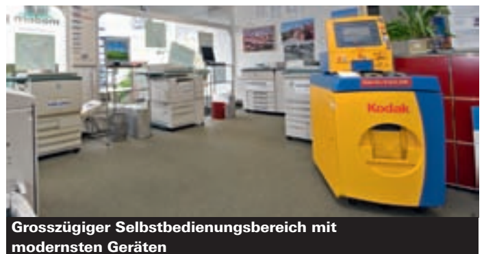
Grosszügiger Selbstbedienungsbereich mit modernsten Geräten

In den Bereichen Copy/Print, Plotten, Posterprint, Aufziehen/Laminieren, Scannen und Ausrüsten stehen die modernsten Apparaturen, Systeme und Geräte zur Verfügung, sodass alle Datenformen und -arten bei LP Copy Center effizient und von kompetenter Hand passend umgesetzt werden können. Die Möglichkeiten sind schier unbegrenzt. Im Selbstbedienungsbereich steht Ihnen eine professionelle Infrastruktur zur Verfügung, wählen Sie selber von PC-Stationen aus leistungsstarke Drucker oder legen Sie Ihre Vorlagen zum kopieren ein. Digitale Bilder in bester Fotoqualität printen Sie an der Kodakstation.